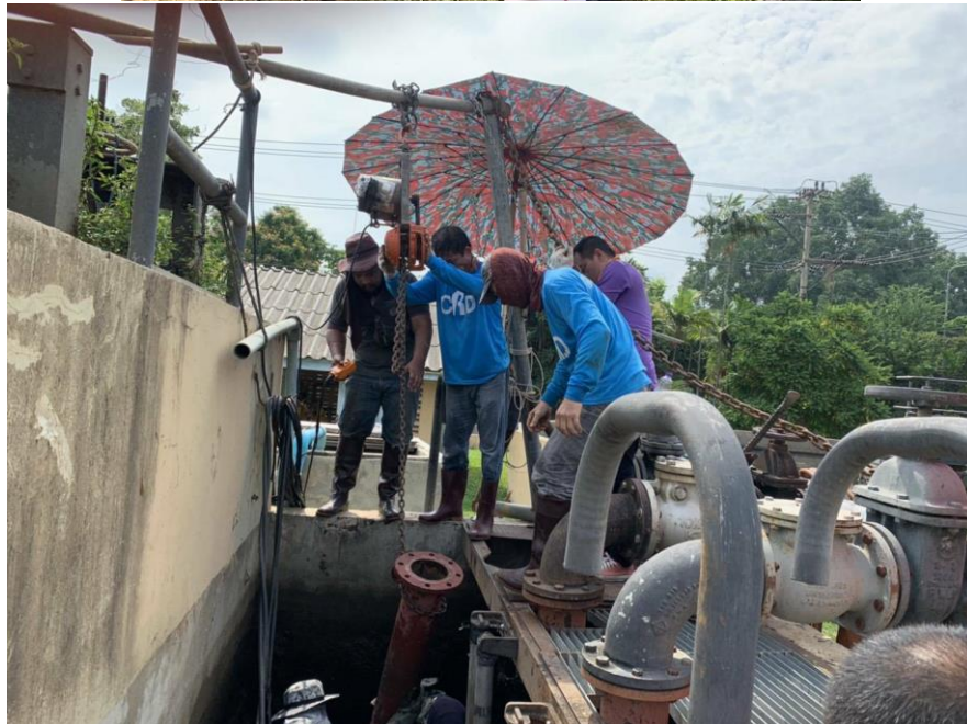
ซ่อมแซมปั๊มหมุนเวียนตะกอน (โรงบำบัดน้ำเสียสวนดอก)