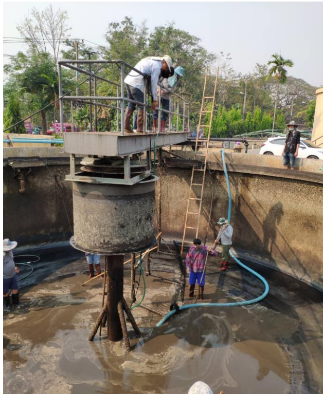
เปลี่ยนใบกวาดด้านล่างและทำความสะอาด บ่อตกตะกอน (โรงบำบัดน้ำเสียสวนดอก)